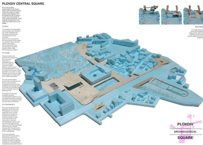
図4 コンペ1 党案 (ポルトガル)

A3:4月から7月にかけて市役所を取り巻く中央広場の国際コンペがありました。最終的にはポルトガルとイタリア、ドイツの3つのチームが残り、ポルトガルのチームが1位に選ばれました。それから、野外劇場プロジェクトが始まっています。これは、古代ローマの野外劇場ですが、私が訪れた頃もオペラ「アイダ」を上演していました。コンサートをしばしば行っており、これを改修する計画です。他にもシメオン皇帝の庭園(公園)の改修とか街を観光都市としていいものをのこしながら、新しく変えています。