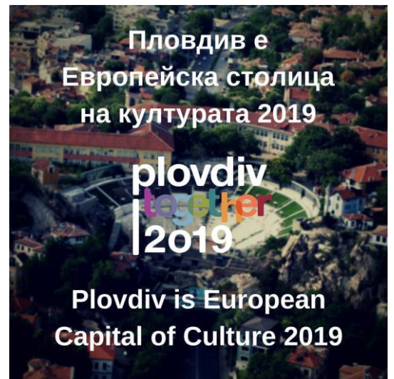
図7 欧州文化首都決定

A6:最新情報です。この10月30日にはアウトソーシング産業の誘致に成功。3つのIT企業が来ることとなります。このように若い市長(1975年生)が古都の魅力を生かしながら、積極的に街づくりを進めています。他の姉妹都市のサンゼ市も歩行者にとって、利用しやすい多機能な街づくりに取り組んでいるとききます。岡山市も姉妹都市にならって、日本で最も人にやさしい都市、自転車先進都市、公共交通先進都市になればいいと思います。