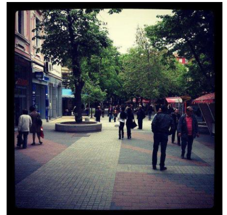
図 2 歩行者モール