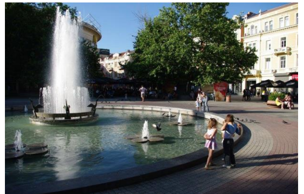
図 3 中央広場

A2: プロヴディフ市は2015年、来年ですがデンマークのコペンハーゲン抜いて、ヨーロッパで最長(1750m)最大のエリアの歩行者空間を持つこととなります。この8月にトテフ市長のテープカットで起工式を終えました。以前からのモールを延長し、石畳の街路も車の進入できない場所を増やして、人が回遊できる空間を広げる事となります。