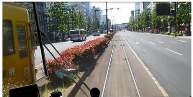
岡山の路面電車軌道敷(柳川電停から岡山駅方面を見る)