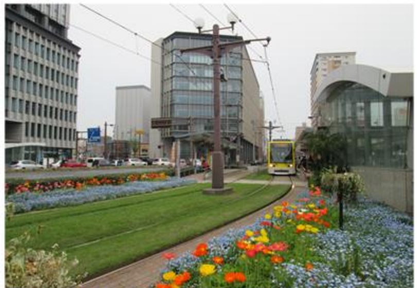
鹿児島市電の芝生軌道(鹿児島中央駅前)