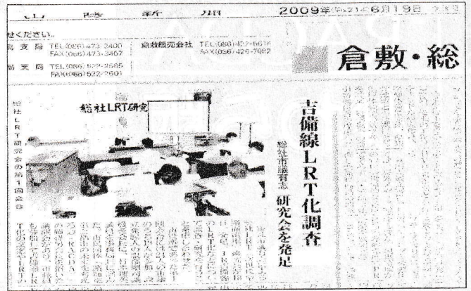
研究会発足を伝える山陽新聞 倉敷・総社圏版。残念ながら、岡山市側は違う紙面になっている。

写真を見てください、ほら、丸い鉄車輪の真ん中に車軸がナイ！それぞれの車輪は軸で繋がらず、独立。じゃあ、モーターからの力はどうやって伝わるの？そんなこと知らないけれど、MOMO導入時、国内のメーカーでは作ることができなかった最新技術なんです。この構造のお陰で車輪の盛りあがり座席部分に、車輪の内側は車内通路にと空間を有効に使う