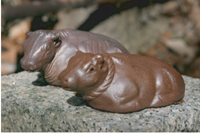
備前焼でできた牛像が奉納されている

● ■正月・五月・九月の5日は大祭で、特に正月5日は多くの参拝者が訪れます。この日にはJR吉永駅から臨時のシャトルバスが運行されます。普段の神社参りとはちょっと違った風習が伝わる牛神様へお出かけされてはいかがでしょうか？