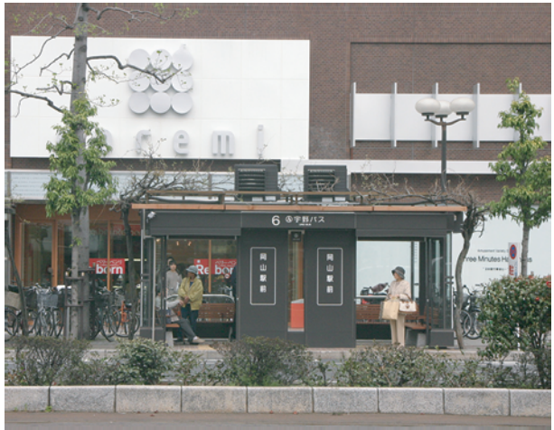
岡山駅前(ドレミの街) 6番のりばに新設された待合室

5月8日にダイヤ改正が行われます。この改正に伴い、中山下BCを発着としていた『辛香・免許センター線』、『ロマンチックロード勝山線』が天満屋BC発着に変更となります。