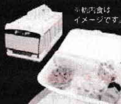
※軌内食はイメージです。